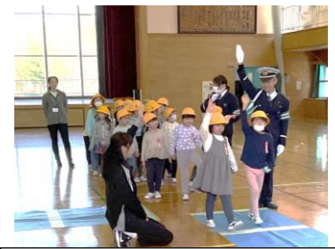
—安全な歩き方を学ぶ1年生—

4月22日(火)に、学年ごとに交通安全教室を行いました。警察・交通指導員の方々においでいただき、安全な道路の歩き方や自転車の乗り方について教えていただきました。